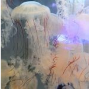
Des méduses de la famille des chrysaora en pleine croissance.