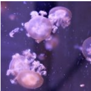
Des « bébés » phyllorhiza .